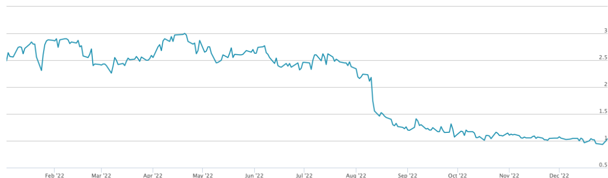
Kuva 1. Osakkeen kurssi raportointikaudella.

Osakkeenomistajien omistustiedot perustuvat Euroclear Finland Oy:n ylläpitämään osakasluetteloon 31.12.2022.